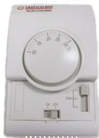
Termostato de Ambiente