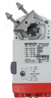
Motor Atuador ON / OFF